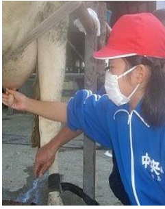
11月11日(日) 親子搾乳体験(雨天中止)