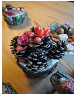
11月17日(土) 親子木工体験