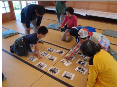
11月10日(土) プロジェクトワイルド KIDSCLUB 自然発見塾