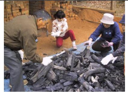
11月10日(土) 炭焼き体験 木酢液プレゼント