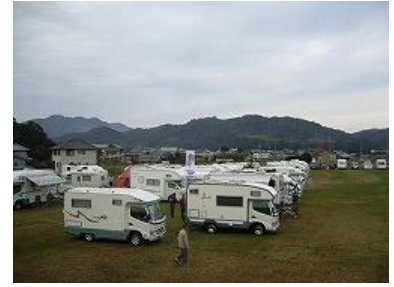
11月10日(土)・11日(日) キャンピングガー大集合