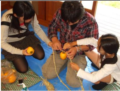
11月10日(土) ほし柿をつくろう