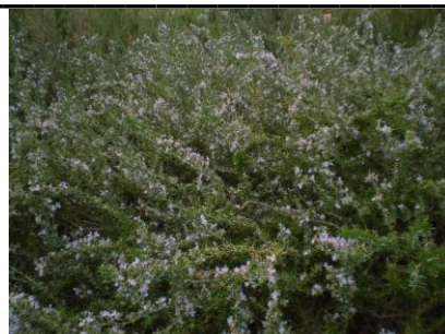
ローズマリー (風花の庭)