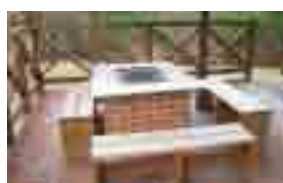
▲テラスでバーベキュー