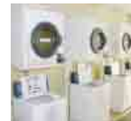
▲コインランドリー